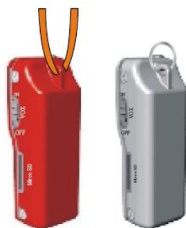
Uchycení na krk, klíče