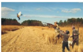
Natáčení venkovních sportů