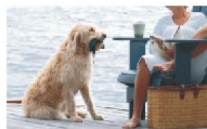
Natáčení domácích miláčků

Zřízení umožňuje řadu dalších využití v praxi: