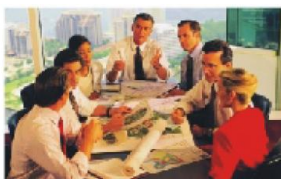
Natáčení úředního jednání