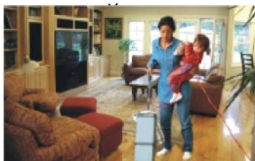
Natáčení dětské chůvy