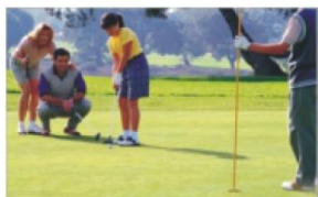
Natáčení rodinných příležitostí