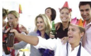
Natáčení oslav a večírků