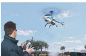
Natáčení z RC modelů